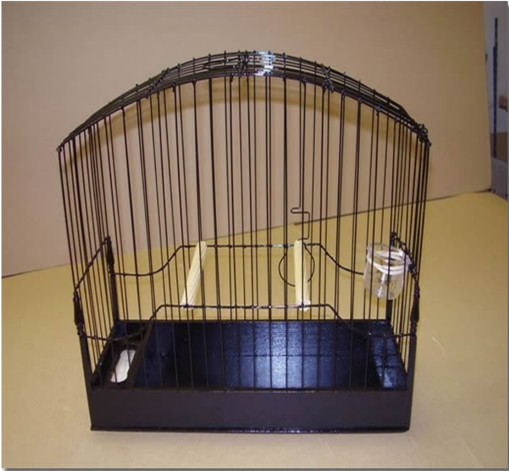
Κλουβί επιδειξης FIFE FANCY